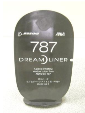
窓部分の切り抜き

裏にボーイング社の787初飛行を成功させたテストパイロット マイケル・リカー氏の直筆サイン入り