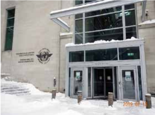
写真1 会場となったICAO本部