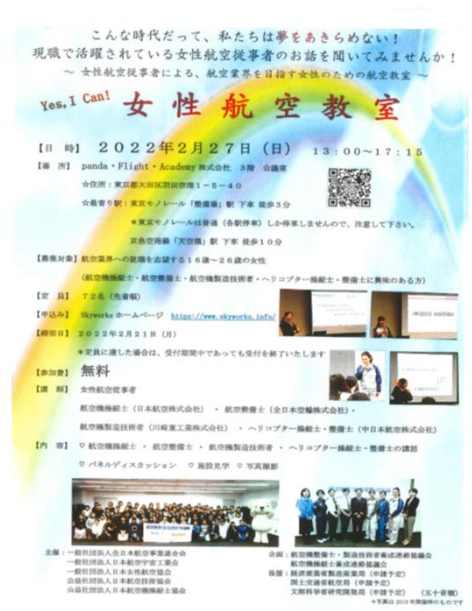
【令和3年度 開催案内】