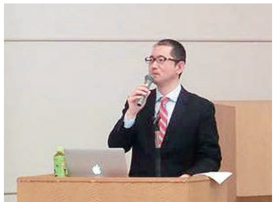
河本 9100APセクターリーダー (MHI)

*1) JIS Q 9100：品質マネジメントシステム－航空、宇宙及び防衛の分野の組織に対する要求事項