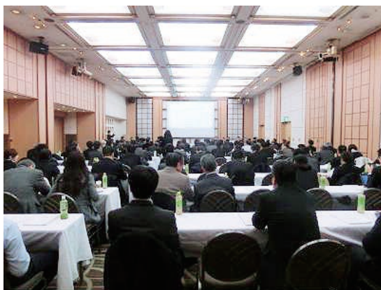
報告会の様子 (名古屋会場)

また、それに先立ち特別講演として、防衛装備庁 調達管理部 企画調査官付 品質管理企画室 室長補佐 長町2等空佐に「防衛装備庁組織改正概要とDSP Z改正動向」と題して講演を頂いた。