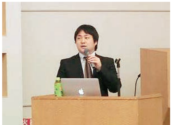
服部 SCMH WGメンバー (MHI) (名古屋会場)