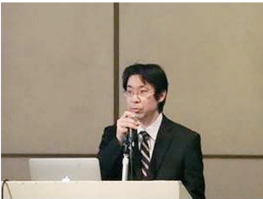
朝倉 要員能力検討WG 主査 (IHI) (東京会場)

IAQG/APAQG及びJAQG活動との相関関係を交え、IAQGに関しては、設立経緯及びミッションに加え、業界規格である9100シリーズ規格の制定とその認証構築・維持を中心とした活動概要、2015年のIAQG成都会議(2015年4月)、IAQGマドリッド会議(2015年10月)、