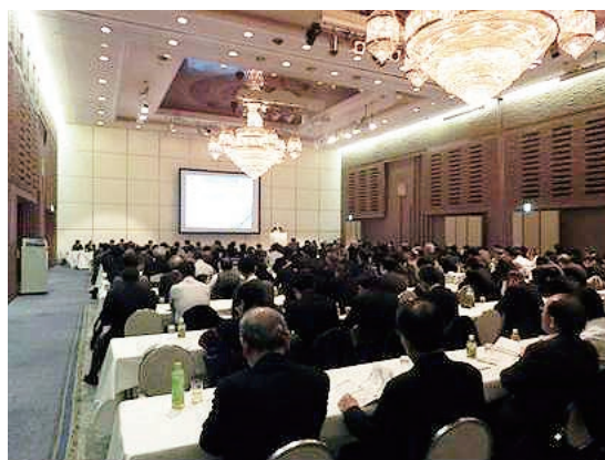
報告会の様子 (東京会場)