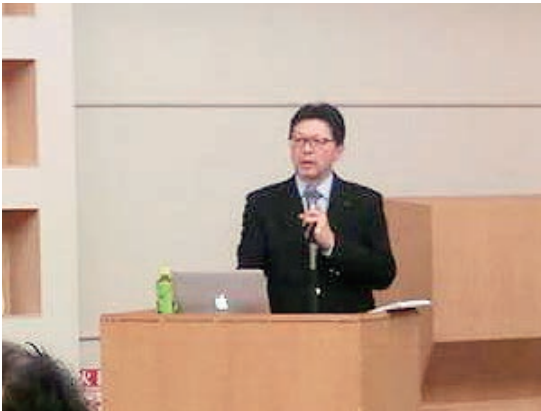
北森 要員能力検討WGメンバー(KHI) (名古屋会場)

なお、次年度以降IAQGでの要員能力検討チームの解散に基づき、JAQGについても本チームは活動をSCMH WGに引き継ぐことが報告された。