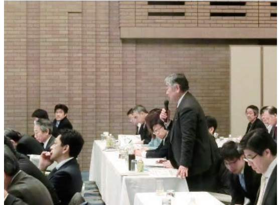
特別講演風景 (質疑)