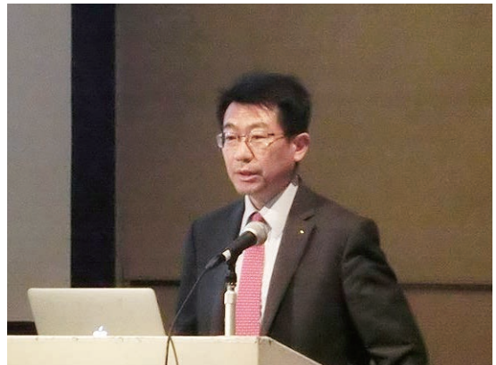
寺境 APAQGセクターリーダー (MHI)