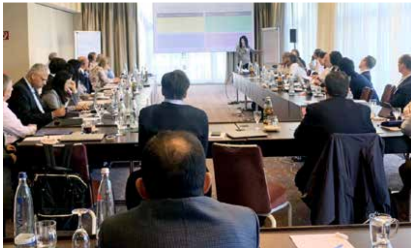
規格要求分科会の様子

か、規格と合わせて作成される展開支援文書の和訳版作成を進めており、適宜JAQGメンバーに提供できるよう国内作業を進める予定である。