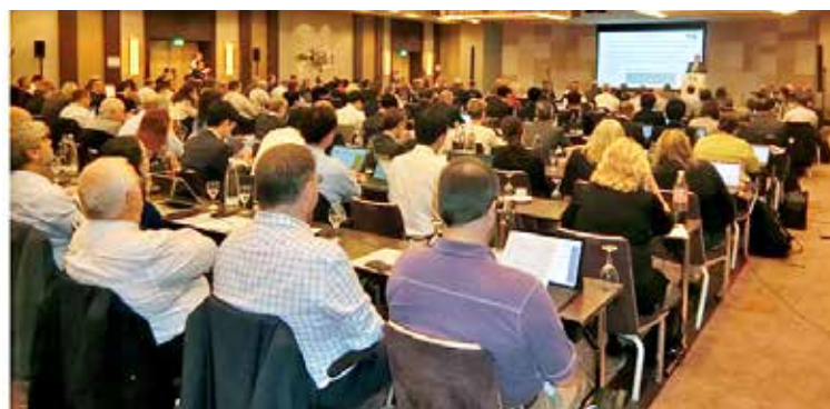
総会の様子 (オブザーバー)