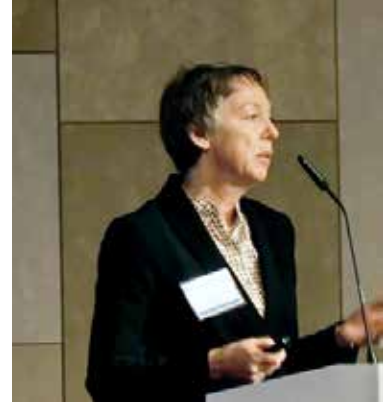
ゲストスピーカー Britta Schade氏 (ESA)