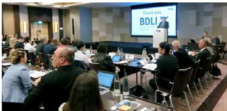
総会の様子 (投票メンバー)