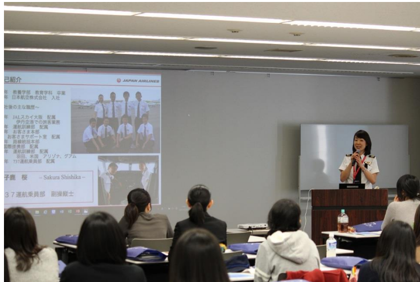
【講演・グループディスカッションの様子】

今年度は12月3日にヘリコプター部会とも連携し、女性操縦士・女性整備士・女性製造技術者による仕事の紹介、講演、グループディスカッションが行われ40人超の参加があった。