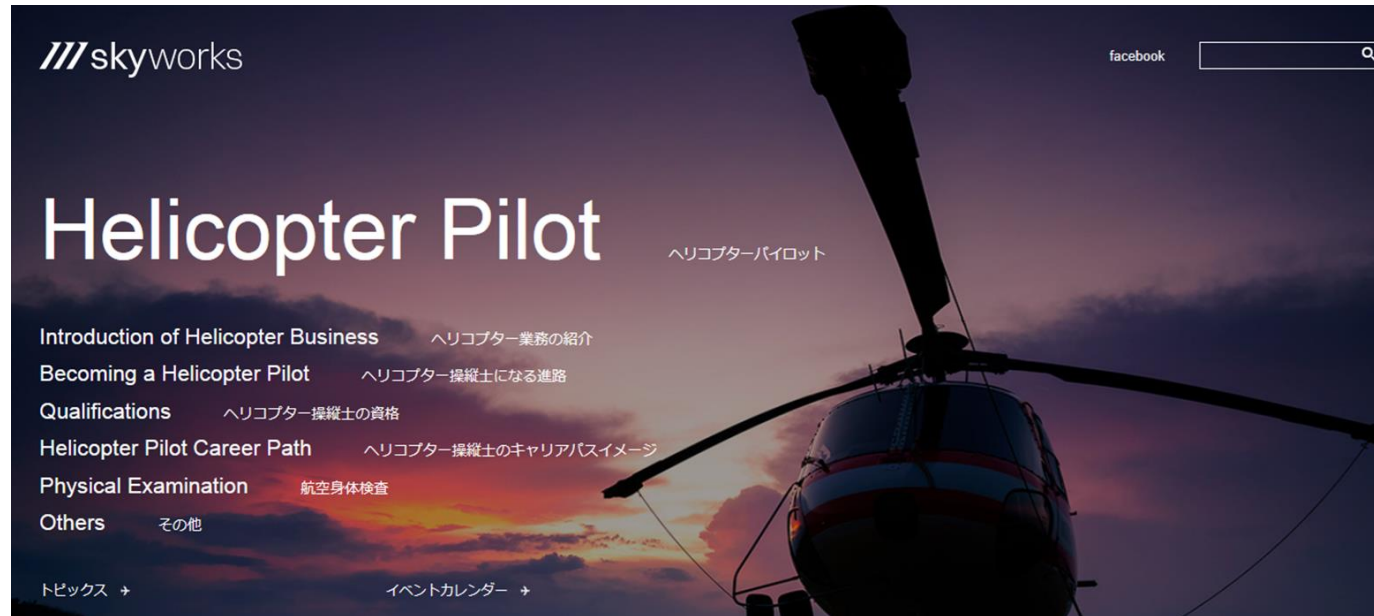
【新設されたヘリコプター職種紹介のページ】

■コンテンツ内容の更なる充実のためヘリコプターに関する職種の紹介ページを整備し、平成29年8月末に開設